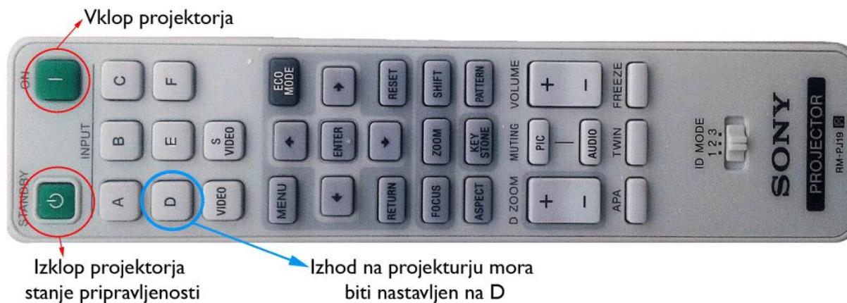
Slika 1: Daljinec za projektor

V predavalnici sta dva projektorja in dve platni, ki so označeni z nalepkami 1 in 2. Za upravljanje obeh projektorjev uporabljate isti daljinec tako, da ga usmerite v želeni projektor. Za vklop projektorja pritisnite tipko ON (desna zelena tipka). Za izklop ali preklop v stanje pripravljenosti pritisnite tipko STANDBY (leva zelena tipka).