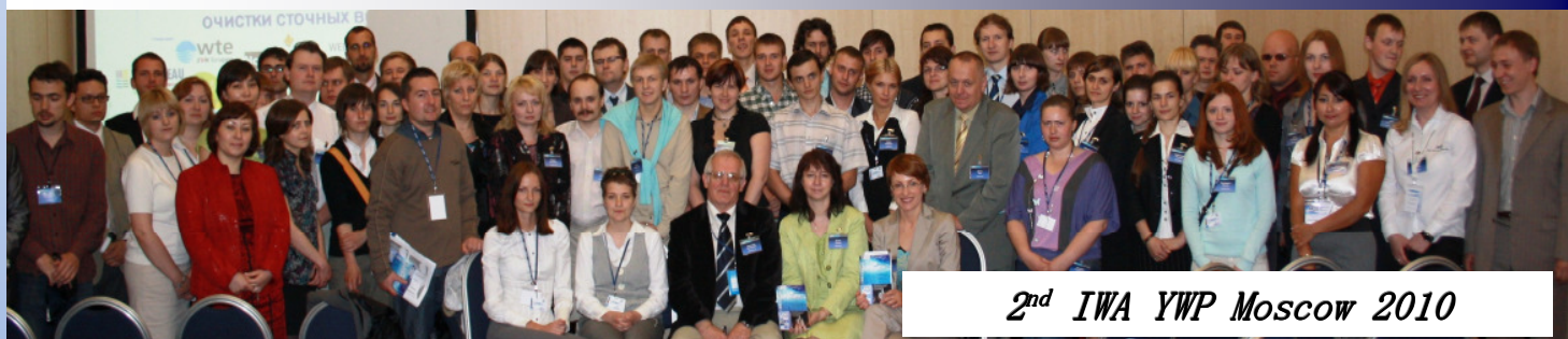
2 nd IWA YWP Moscow 2010