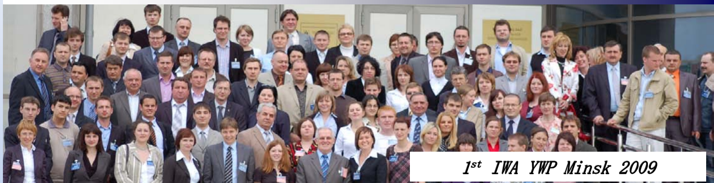
1 st IWA YWP Minsk 2009

About IWA YWP Eastern Europe. IWA Young Water Professionals Programme provides a platform for young professionals and postgraduate researchers from Eastern Europe, CIS and other countries to present their work related to advances in water supply and sanitation.