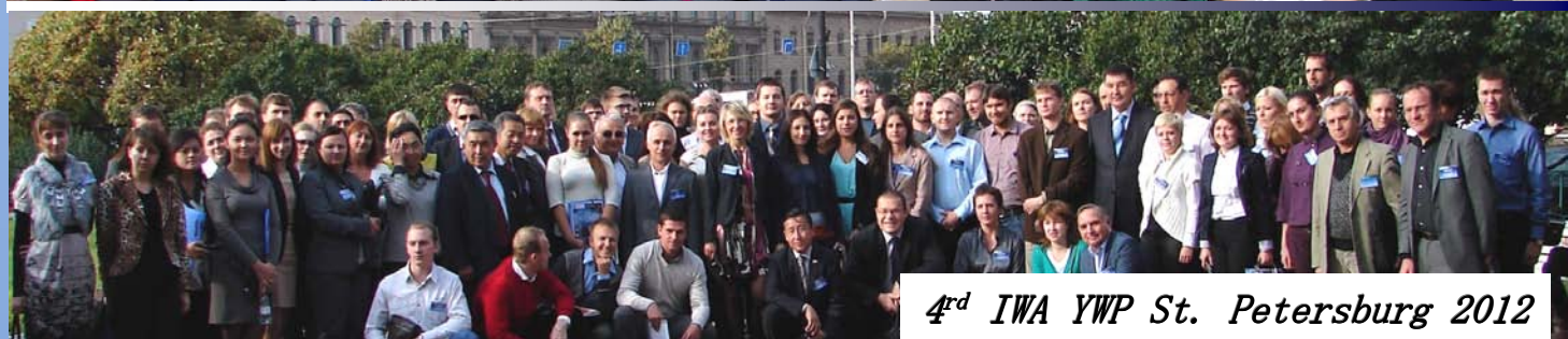
4 th IWA YWP St. Petersburg 2012