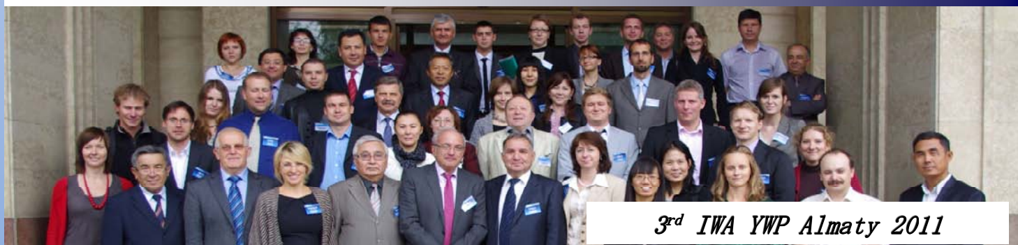
3 rd IWA YWP Almaty 2011